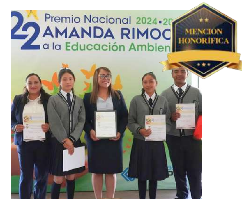
TELESECUNDARIA FEDERAL LEONARDO DA VINCI

“¡Ama tu río! Acción ambiental comunitaria en Malinalco