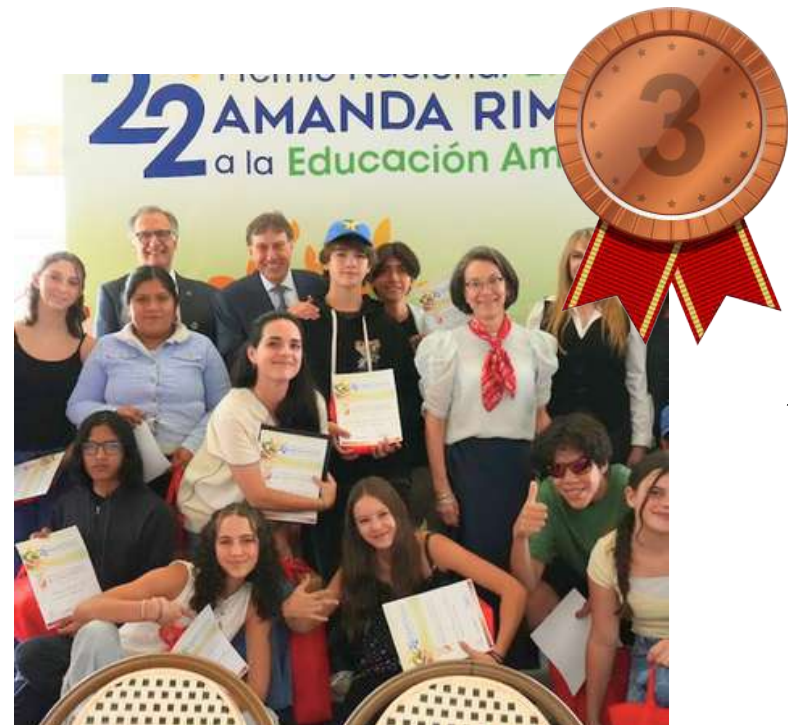
SECUNDARIA VIVA AMEYALLI

“Re-agua verde: Recupera, Recicla, Reforesta para educar con conciencia.”