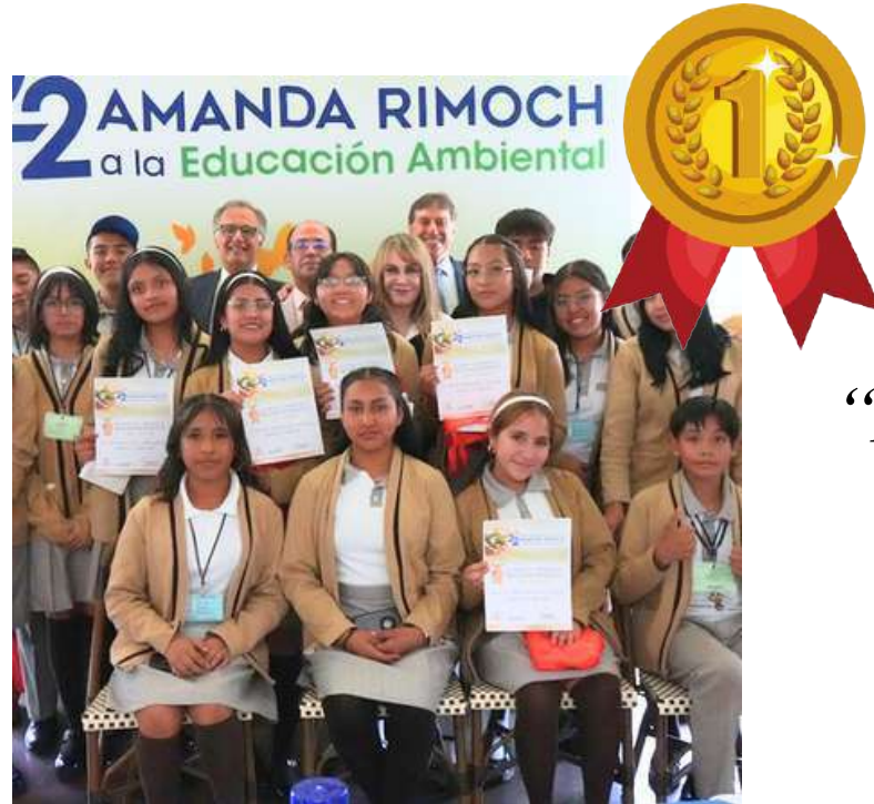
SECUNDARIA TÉCNICA N° 34 “ING. LUIS V. MASSIEU