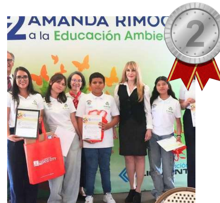
SECUNDARIA GRAL N° 6 “JOSÉ GUADALUPE POSADA

“Re-agua verde: Recupera, Recicla, Reforesta para educar con conciencia.”